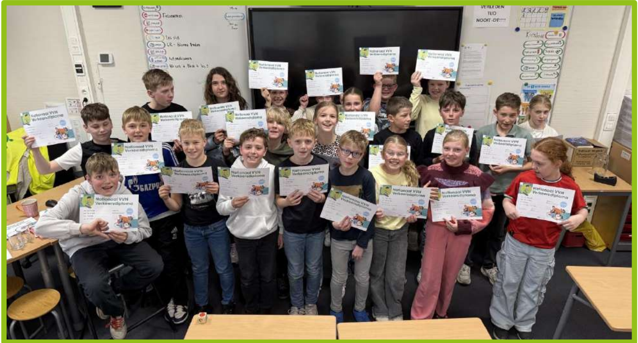
Alle kinderen van groep 7 zijn geslaagd voor het theoretisch én het praktijkexamen Verkeer! 🎉