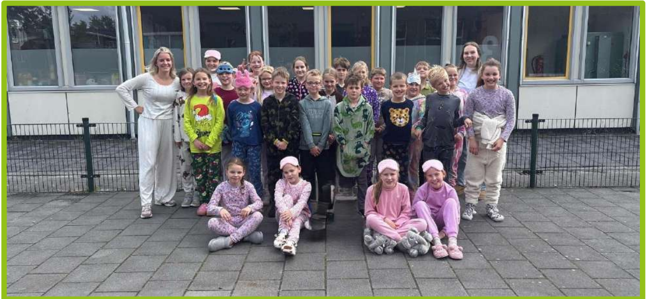
Groep 5 hield een pyjamadag.