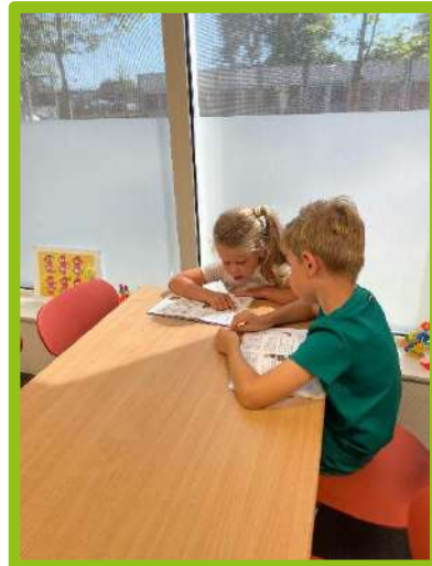
Op een creatieve plek lezen met een maatje in groep 3.