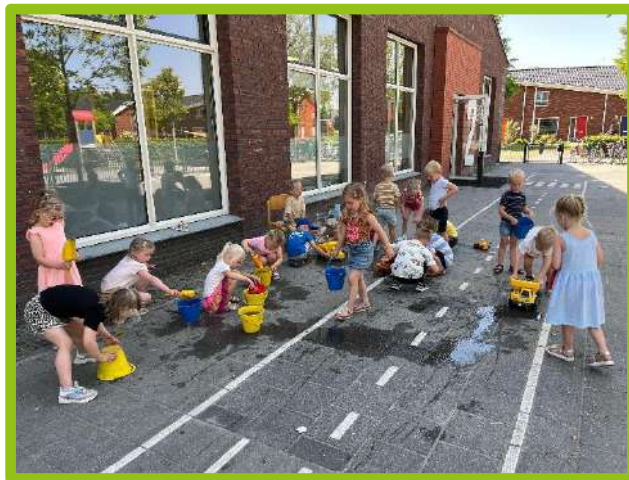
De kinderen van groep 1C hebben tijdens het buitenspelen heerlijk genoten met een paar emmertjes water.