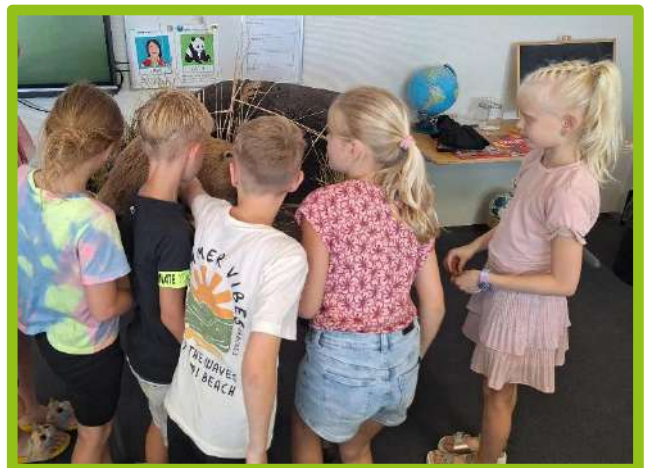
In groep 4 konden de kinderen genieten van een spreekbeurt over (en met) een bever!