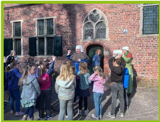
Groep 3 bezoekt Klooster Ter Apel.