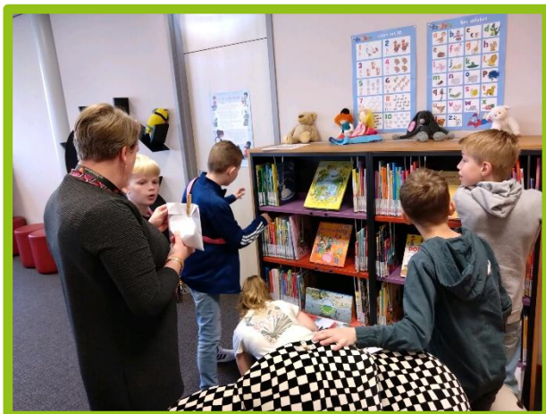
Voor de groepen 5 en 6 was de bibliotheek veranderd in een escaperoom.