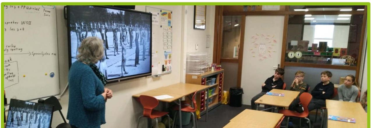
In de groepen 7 en 8 kwam een gastspreker WOII-heden vertellen over de nare gevolgen van de oorlog in hun families.