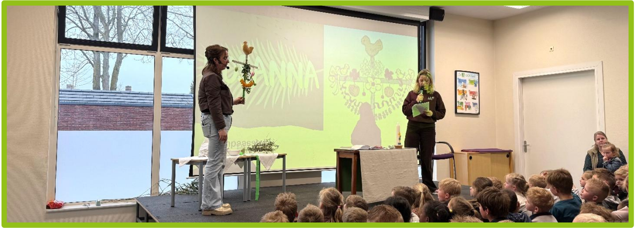
De gezamenlijke Paasviering en -lunch op 2 april.