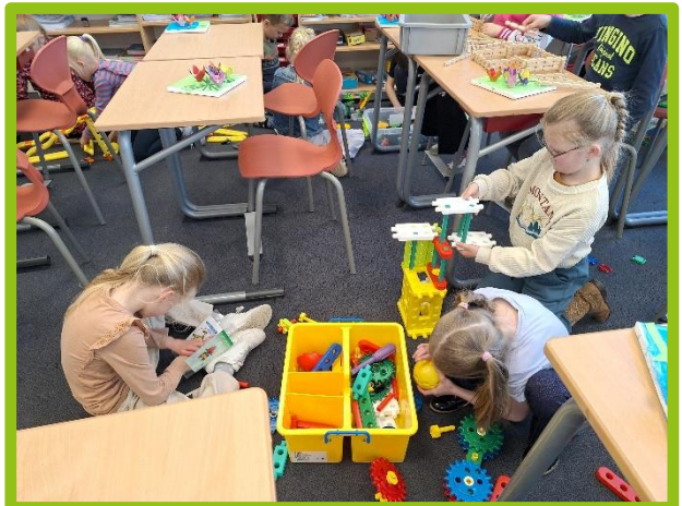
Techniekles in groep 4.