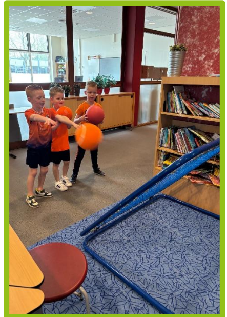
De KoningsSpelen, erg moeilijk om een selectie te maken uit de vele prachtige fotos!