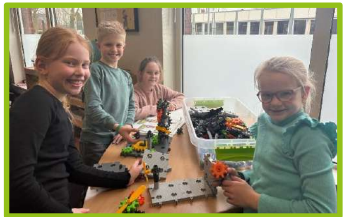
Ook groep 5 is weer lekker technisch bezig geweest.