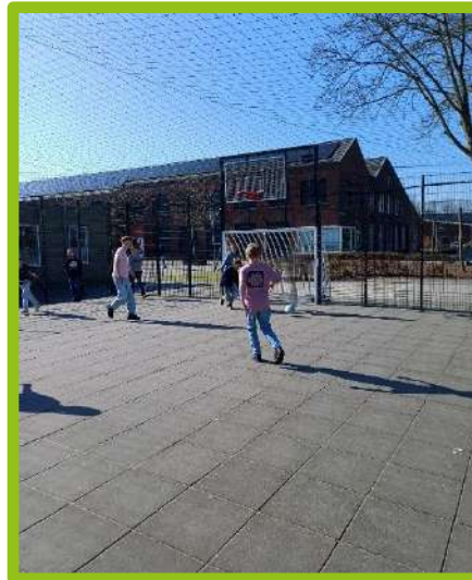
Groep 8 heeft een muurkrant gemaakt over de gemeenteraadsverkiezingen en genoot in de pauzes heerlijk van het zonnetje.