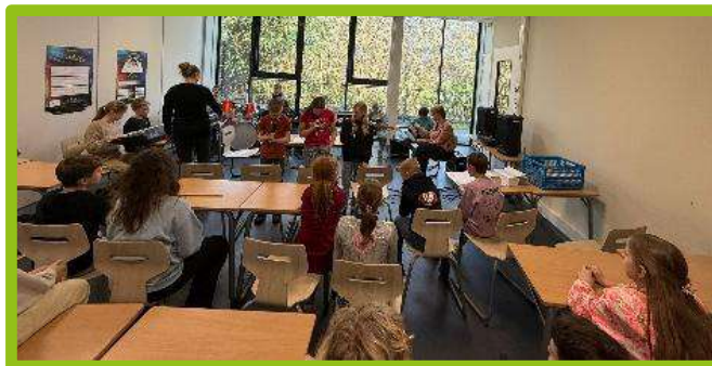
De kinderen van groep 7 hebben in een optreden voor elkaar laten horen hoe muzikaal ze zijn.