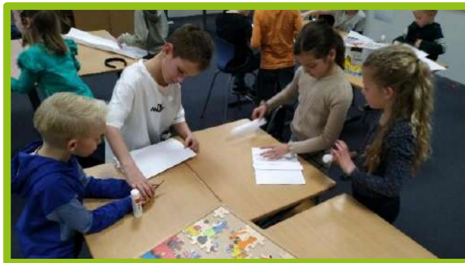
Groep 3 heeft ontdekt hoe je met papier een stevige brug kunt bouwen.