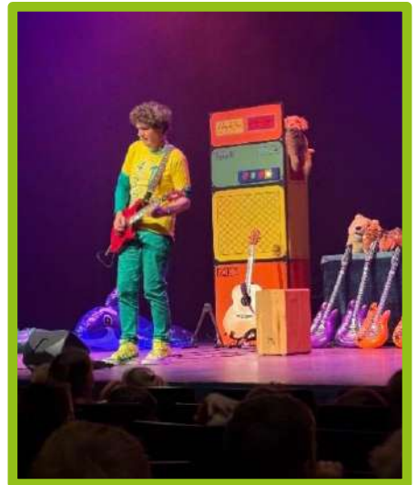
De groepen 1 en 2 hebben veel gedaan: "Stapelstad", lezen en nog veel meer. Als klap op de vuurpijl bezochten ze Theater Geert Teis.