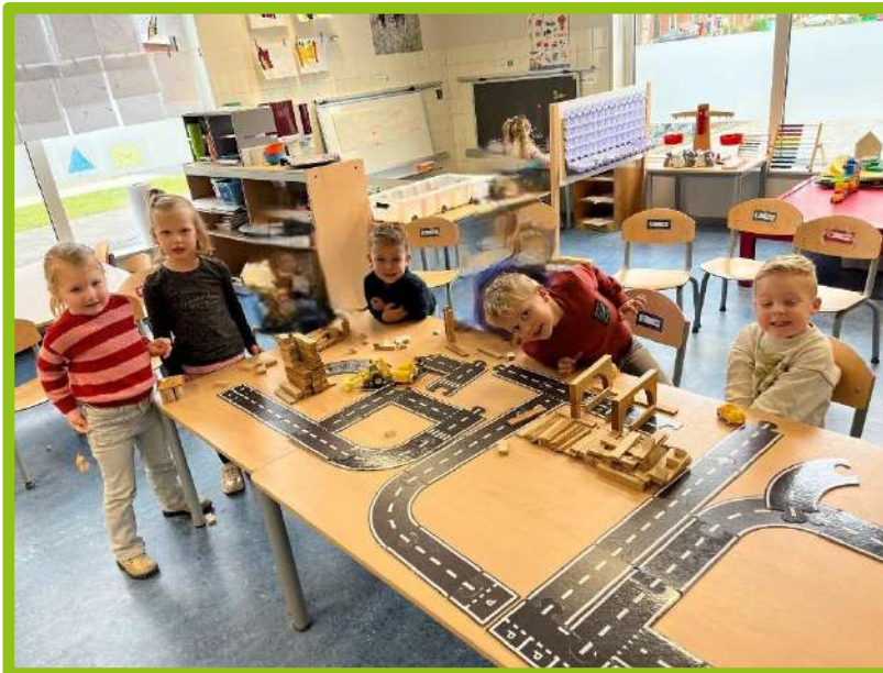
In groep 1 is fanatiek gewerkt aan "Stapelstad".