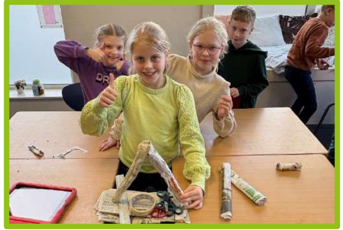
De kinderen van groep 4 hebben ontdekt met welke constructie(materialen) je de sterkste brug kunt bouwen.